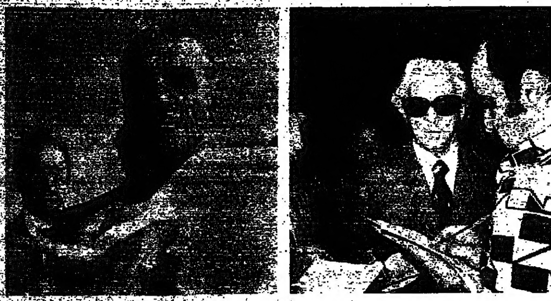
الرئيس شمعون يتحدث الى الصحفيين في قصر بعبدا بعد مقابلة الرئيس فرنجية .

ارتدت الإزمة الوزارية الى الاسبوع المقبل ، بعد اجتماع الرئيس فرنجية والجميل ، ومع ان نتائج الاجتماع جاءت على عكس بوادر التفاؤل التي كانت سائدة قبل الاجتماع ، وبالنسبة الى حل في مطلع الاسبوع المقبل ، وكان الرئيس فرنجية قد استقبل الرئيس شمعون والجميل في القصر الجمهوري ، وكان الرئيس شمعون والجميل قد استقبل عند الساعة الحادية عشرة والنصف